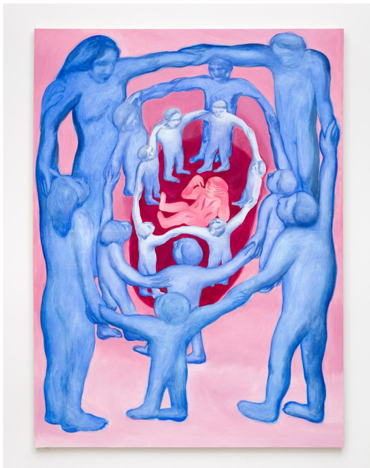
A kilábalás története 3