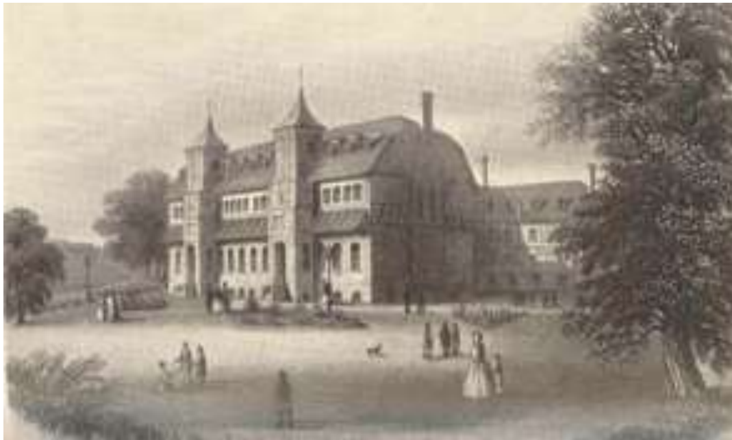
1. kép: Harmony Hall

„A konyhaberendezés maga minden képzeletet felülmúlóan szép volt, s a londoni építész, aki készítette, kijelentette, hogy még Londonban is igen kevés ilyen tökéletesen és drágán berendezett konyha van; látogatónk ezzel a megjegyzéssel egyetért. A konyha mellett kényelmes mosodák, fürdők, pinchelyiségek és olyan elkülönített helyiségek voltak, ahol munka után minden tag megmosakodhatott. Az első emeleten egy nagy bálterem volt, fölötté a kényelmesen berendezett hálószobák.” (MEM. 2. kötet, 1959, 501.)