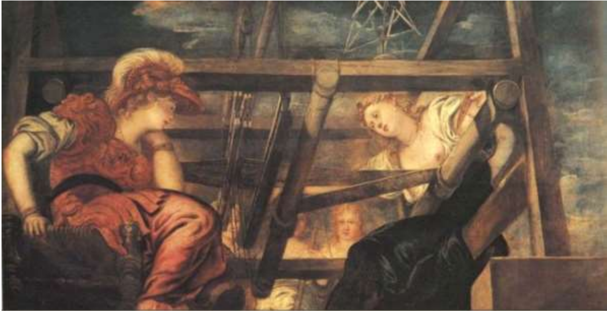
Tintoretto: Athéné és Arakhné

kovács rávetette magát a gyanútlan Athénére; az természetesen ellenállt, s a dulakodásban a földre rogyó Héphaisztosz véletlenül magát a földet, azaz Gaia Földanyát termékenyítette meg. A földből megszülető, kígyólábú fiút azonban megsajnálta Athéné, és sajátjaként nevelte fel Erikhtonioszt, aki az első athéni király lett, s halála után a „Kocsihajtó” csillagkép, mivelhogy ő találta fel a lovas kocsit. Máskor Poszeidón azzal bosszantotta Athénét, hogy az egyik legszebb tengeri istennővel, Medúzával, a Gorgóval egy Athéné templomban enyelgett. Athéné ezért kígyóhajúvá változtatta a szerencsétlen lányt, olyan rémisztőre, hogy aki ránézett, kővé vált. Később Perszeuszt segítette Athéné, aki megölte Medúzát, s fejét, a rémületes Gorgó-főt, az istennő pajzsára illesztette. Medúza halálakor adott életet Poszeidón fiának, a művészeknek ihletet hozó szárnyas lónak, a múzsák kedvencének, Pegazusnak.