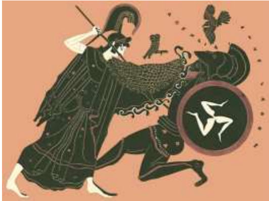
Athéné legyőzi Enkeladosz gigászt (ókori amfora ábrázolás)

Athéné nyerte el a várost. Az olajfa ezer évig él, nincs természetes ellensége a rovarok és a növényevő állatok között, túri a szárazságot, nem igényel metszést, kapálást, permetezést vagy más gondozást, értékes a terménye és a szüretelése sem munkaigényes: mindössze egy hálót terítenek alá, mert csak a magától lehullott bogyó dolgozható fel.