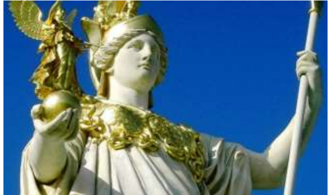
A Győzelem istennőjét, Nikét a kezében tartó Athéné szobor Bécsben, a Parlament előtt