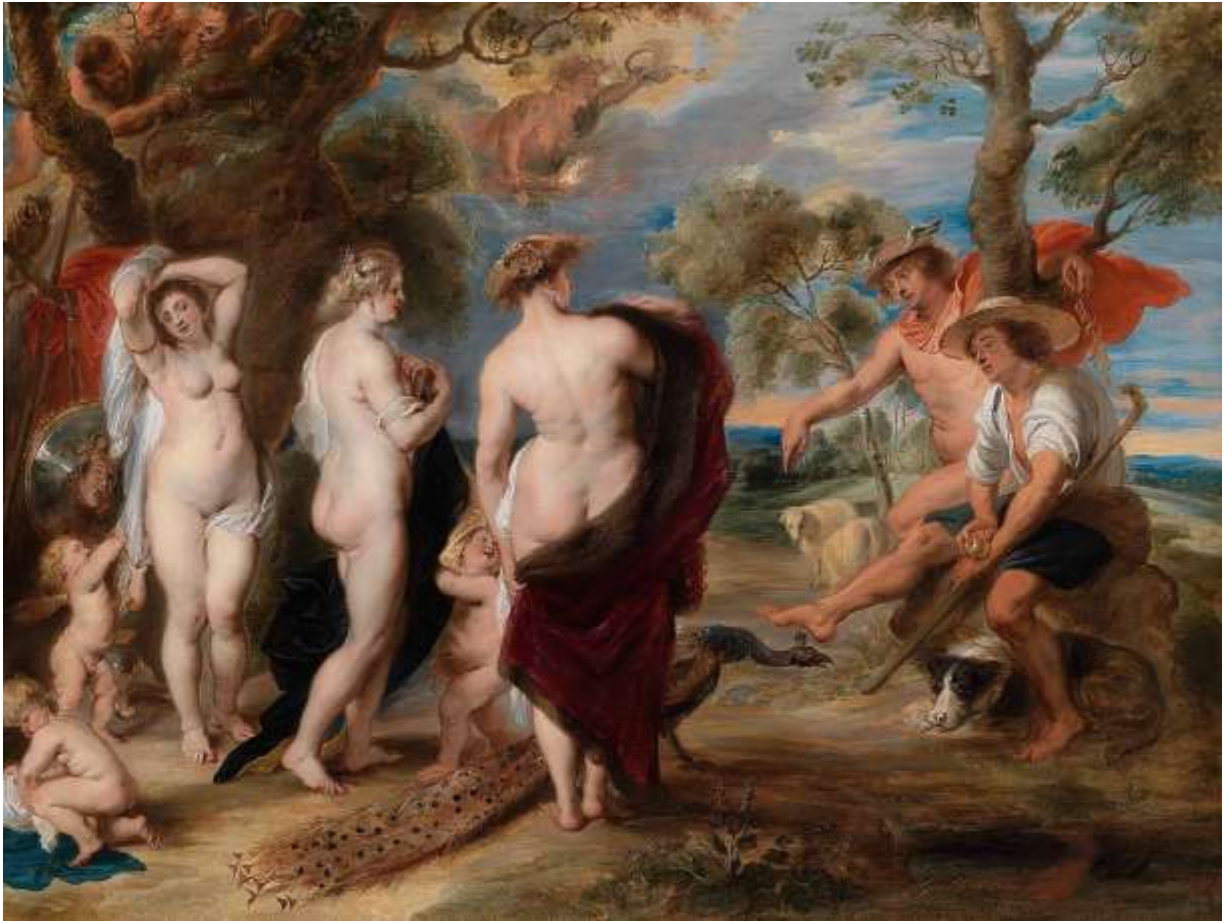
Rubens: Parisz ítélete A három istennő, Athéné, Aphrodité és Héra szépségversenye Parisz trójai királyfi, mint döntőbíró, és Hermész isten előtt

volna Pariszt. A versenyt azonban Aphrodité, a szépség istennője nyerte természetesen, aki egy igazi férfi számára ezeknél kézzel foghatóbb dolgot, a világ legszebb halandó nőjének (a spártai Szép Helénának) a szerelmét ígerte Parisznak. Ezzel kezdődött a trójai háború, melyben Athéné és Héra a görögöket, Aphrodité a trójaiakat támogatta értelemszerűen.