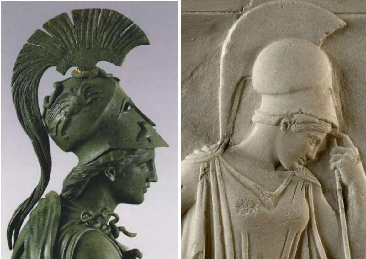
Athéné bronzszobra Krisztus előtt a IV. századból (balra) és a legismertebb Athéné dombormű, a „Gondolkodó Athéné” (jobbra)

kovácsnak szánt erős fiúknak az ókorban eltörték a lábát, nehogy katonának állva elhagyják a közösséget, vagy, ami még rosszabb, elvigyék magukkal vasfegyvert kovácsolni képes tudásukat.)