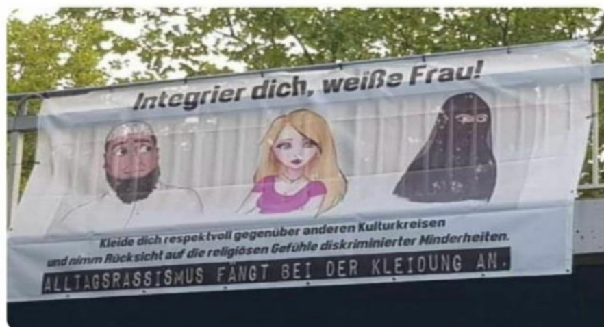
1. kép: „Integrier dich, weisse Frau!”

Heute entdeckt auf der B1 in Dortmund. Ich bin sprachlos.